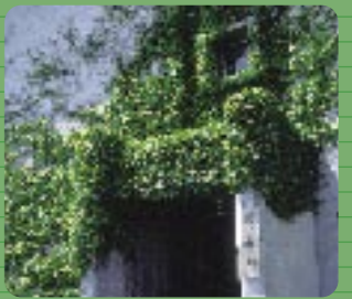
歴史を感じる建物。取り囲んでいる蔭が四季を知らせてくれることでしょう。