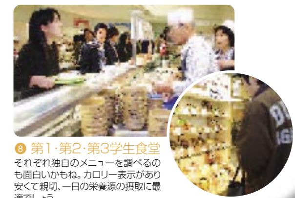
8 第1・第2・第3学生食堂 それぞれ独自のメニューを調べるのも面白いかもね。カロリー表示があり安くて親切、一日の栄養源の摂取に最適でしょう。