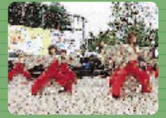
第1学生食堂前 黎明祭、新大祭のメイン会場となる広場。