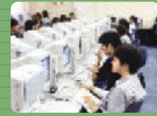
6 IT自習室 空いた時間に自由に使用可能です。