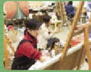
4 教育人間科学部 授業風景、作品製作。