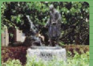
この像の名前とこの人を知っていますか。キャンパス内を探索するのも楽しいです。きっと新たな発見があるでしょう。