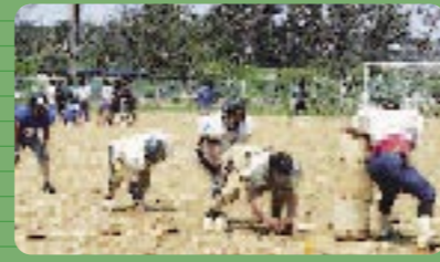
3 グラウンド 部活動が花盛り、頭と体両方鍛えましょう。