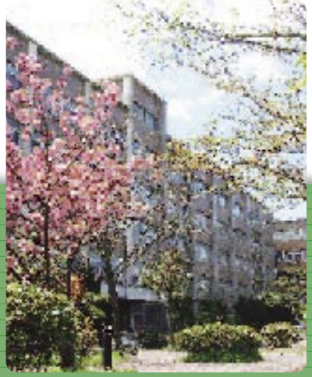
1 理学部棟 五十嵐キャンパスのほぼ中央に位置します。