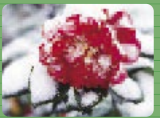
冬、キャンパス内で見ることができます。それには、日頃の洞察力が必要です。