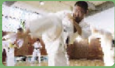
2 体育館 真剣なのは勉学だけではありません。