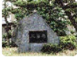
工学部の石碑 日頃は気づかないまま通り過ぎてしまします。