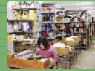
5 附属図書館 静かに自分の時間を過ごすならば最適な場所でしょう。