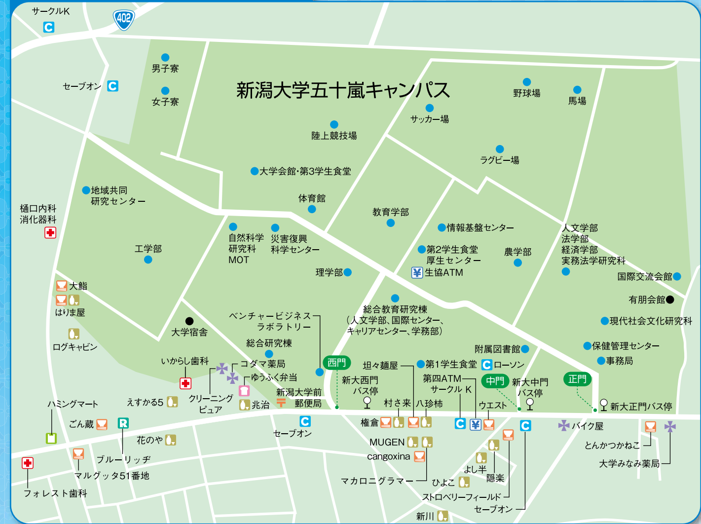
この地図は2009年3月現在のものです