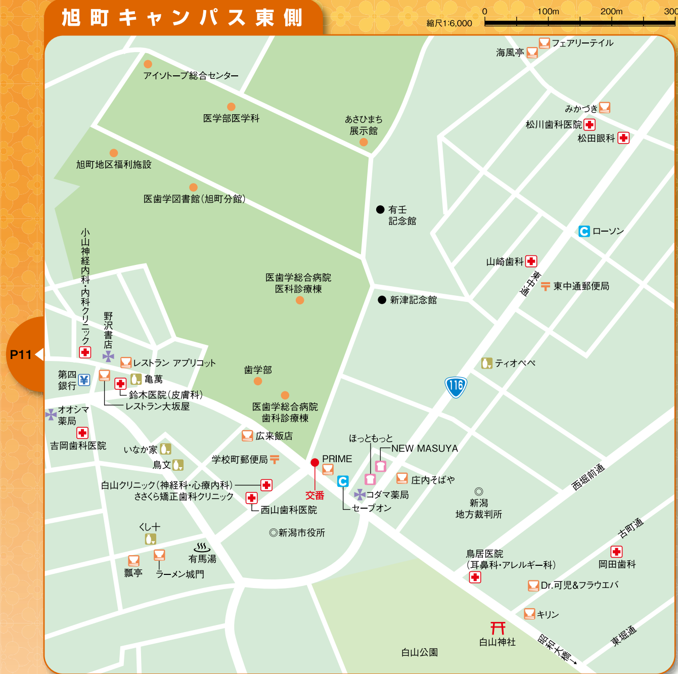
この地図は2009年3月現在のものです