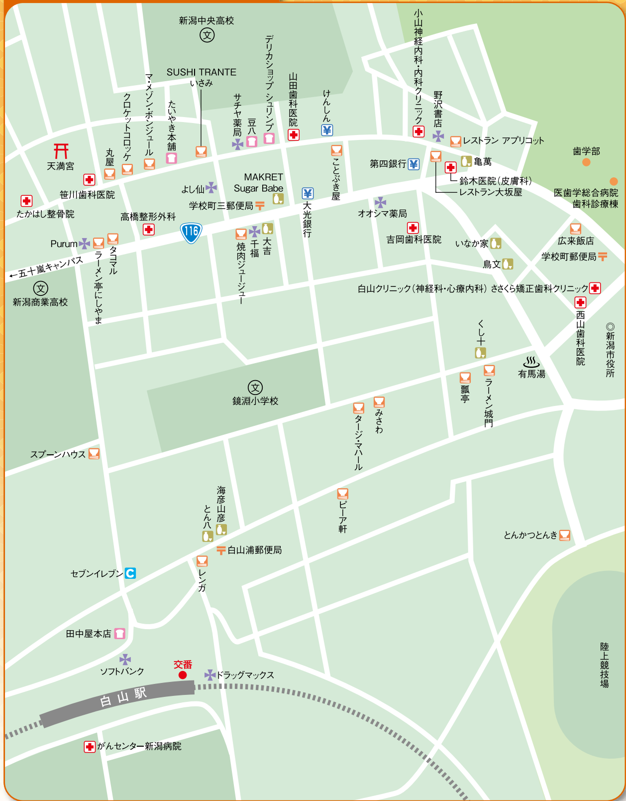
この地図は2009年3月現在のものです