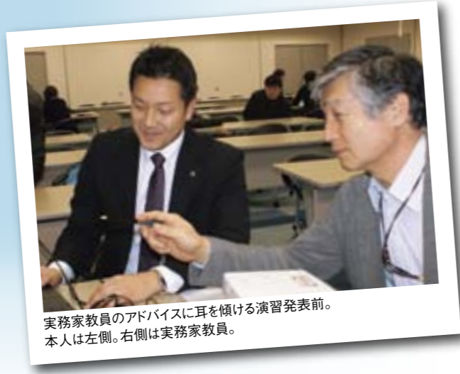
実務家教員のアドバイスに耳を傾ける演習発表前。本人は左側。右側は実務家教員。

最後になりましたが、会社のみなさんや家族には通学のため、私のわがままに理解と協力をしていただいたことを本当に感謝しています。