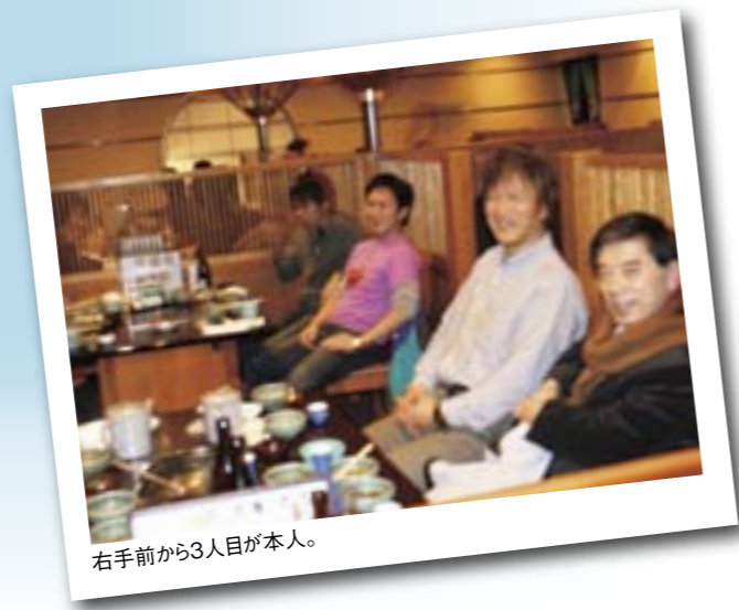
右手前から3人目が本人。

大学院生活は本当に短く感じるものの、今までの人生で最も充実した2年だったと思います。