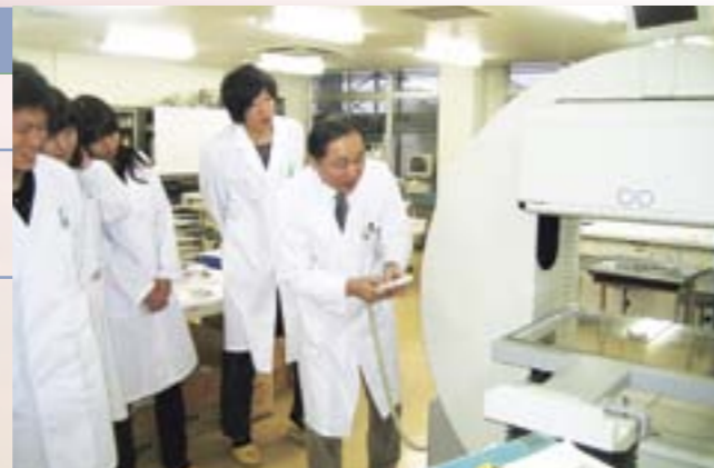
核医学画像診断装置(SPECT)の性能評価実習。

昭和43年に新潟大学医学部附属病院に就職し、放射線科教授の指導のもとに放射性同位元素(ラジオアイソトープ:RI)を用いて疾病の診断と治療を行う「核医学診療」を開始し、合わせて密封小線源や放射線業務従事者の被曝線量の管理などに従事してきました。その後、医療技術短期大学部、医学部保健学科にお世話になりました。42年間には数多くの思い出がありますが、中でも学生教育を主体にした「非密封RI使用施設」の設置に携わってきたことが特に心に残っております。この施設には40名の学生が化学系の実験を同時に行える実験室があり、放射化学実験、放射線管理学実験、放射性核種のエネルギーに対応した計測法の習得、更に施設内に保有する核医学画像診断装置(2検出器型 SPECT)によって機器の性