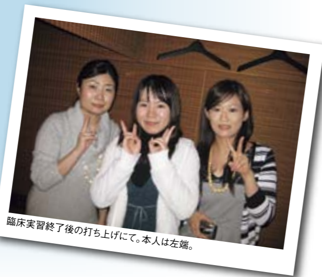
臨床実習終了後の打ち上げにて。本人は左端。

冬の連日鉛色の空が大嫌いで、新潟って嫌だな...と思った時期もありましたが、鉛色の空を見ればこそ思い出すことも沢山あります。6年間で出会った方々、支えてくれた家族、そして新潟の地に感謝しています。