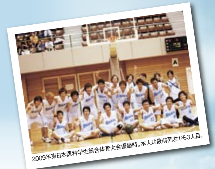
2009年東日本医科学学生総合体育大会優勝時。本人は最前列左から3人目。

近年、医師不足、医療崩壊、医療費の増大など、医療界を取り巻く情勢は厳しくなっています。そのような中で、社会が医師に求めるものは知識・技術だけではなく、一人の人間として患者さんと真摯に向き合える力が必要とされています。新潟大学での教育は必要十分な知識を与えてくれましたし、ここでの出会いが医師となりうる人間力を育んでくれました。今や第二の故郷となった新潟に感謝しつつ、人の心がわかる医師になれるよう、これからも努力していきたいと思えます。