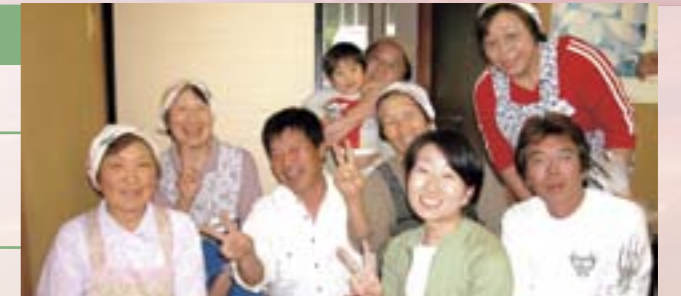
中山間地森光の恋人たち。

本学勤務の後半は、平成13年の農学部改組に伴って新設されたフィールドセンター企画交流部に異動し、地域への窓口として情報発信・収集作業を行った。巨大な自然災害に襲わ