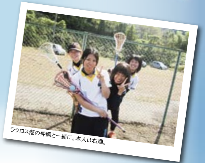
ラクロス部の仲間と一緒に。本人は右端。

卒業という節目を迎えますが、いつも温かく見守ってくれた家族、指導してくださった先生方、共に過ごしたたくさんの仲間への感謝の気持ちを忘れず、今後自分の夢や目標に向かって日々精進していきたいと思っています。