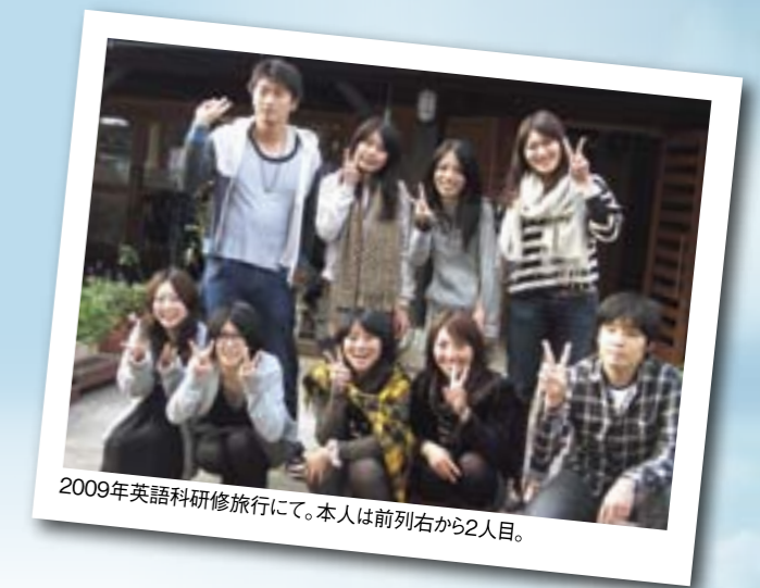
2009年英語科研修旅行にて。本人は前列右から2人目。

もう大学を卒業すると思うと、この4年間は実にあっという間であつたということを実感する。しかし、その短い期間の中でも、やりたいことはやってきたし、教員になるという自分の夢も実現することができた。そのように充実した大学生活を送ることができたのは、もちろん私1人の力ではない。私の周りには様々な人たちの力があってこそ、この4年間を楽しく過ごすことができた。今強く感じている。新発田から通っていた私を献身的に支えてくれた家族。上の人への礼儀や周りを見て行動することの大切さ、努力が実ってみんなで喜び合うことの素晴らしさを教えてくれた部活のメンバー。お互いに刺激し合い、高め合い、同じ苦しみも楽しさも一緒に味わってきた英語科の仲間。すべての人に感謝したい。そして、新潟大学で出会えたという一期一会ならぬ「越後一会」の縁を大切に、常に感謝の気持ちを忘れず、これからも人とのつながりを強く持っていきたい。