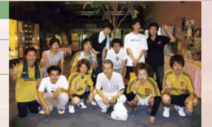
研究室での卓球大会。

その後、全国の大学における工学部の拡充改組において、大講座制となり名前からは良く理解できないような学科が誕生してその運営においても、また新学科創設においても多くの時間を費やしました。それから大学院博士後期課程が設立され、理工農を中心とした研究体制に生じたネジレ現象の解決に向けて何回かの改組があり教育研究体制が著しく充実した感があります。そ