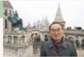
2009年12月でデブレツェン出張時、ブタペストにて。

長年お世話になった教職員の皆様や出会った学生諸君に感謝し、新潟大学の更なる発展を願いつつ退職の挨拶とさせていただきます。