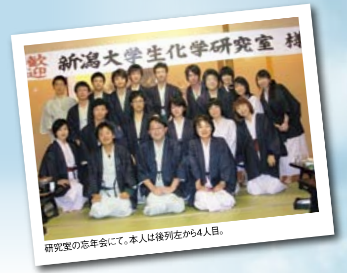
研究室の忘年会にて。本人は後列左から4人目。

さて、4月から私は新潟を離れ、社会人として新たな環境に身を置くこととなります。新潟大学出身者としての誇りを胸に、少しでも世の中の役に立てればと思います。