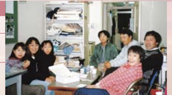
生物科学生控室での談笑。

33歳で採用され、人生の半分を教育学部で送ったことになりました。教育学部には同僚性にあふれた教員集団があり、熱意のある学生諸君に恵まれ、過酷な競争とは無縁の「タンポポ属の種分化の研究」というテーマに一貫して取り組むことができました。家族と共に行かせていただいたオランダでの在外研究が大きな転機となり、「シロバナタンポポ、ウスギタンポポの起源」の解明という成果を挙げることができました。学生諸君を指導した卒業研究では、自然に囲まれている新潟大学の地の利も生かし、30種以上の野生植物の生活史の研究に取り組みました。ヒストリーとは「物語る」という意味なのだそうですが、生活史はまさにその植物のおもしろさを物語ることでなければならないといつも言って来ました。私は「教師には教えるべき内容を創り出す