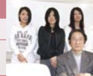
昼間ゼミのみなさん。