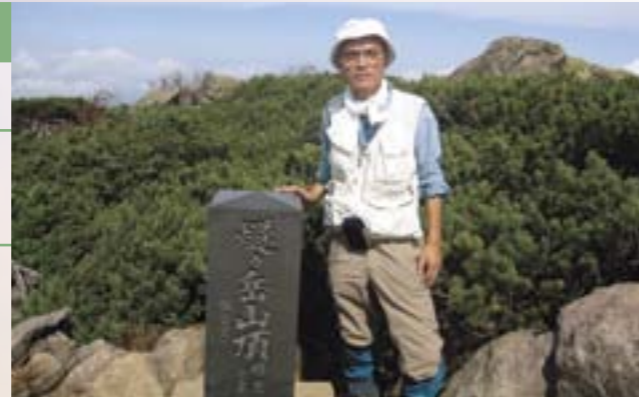
「29年の記録」用の露頭写真撮影の一環として燧ヶ岳火山に登ったときのもの。(平成21年9月27日撮影)

昭和56年2月に本学に着任して以来、早くも29年が経ち、無事定年退職を迎えました。これまでご支援くださいました多くの教職員の方々に感謝申し上げます。29年前に内野駅に降り立ち、徒歩で理学部へ向かった途中にはほとんど人家がなかったと記憶しています。現在の本学周辺の発展からみれば隔世の感があります。大学も大きく変化しました。着任当時はどんなに熱心な学生でも理学部では修士課程止まりでした。博士課程ができるとともに研究もおおいに深化しました。私は本学の右肩上がりの発展過程の道のりとともに歩むことができたことを至福のことと感じています。私は本学着任時に、これからなすべき島弧火山岩研究の本の苗を植え、それを枯れることなく頑丈なものに育てることを目標としてきました。その目標の達成のため