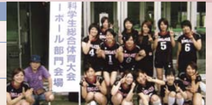
歯学部女子部バレー部の皆さんと共に。

歯科治療や抜歯は、今でも患者さんには痛い、恐ろしい、不安、不快なものと思われています。歯学部6年生の病院実習で、痛く辛い病气から解放するはずの歯科治療自体に苦痛が伴うことに疑問を持ち歯科麻酔学の道に進みました。赴任時のプレハブ研究室で一人からスタートして、「歯科治療恐怖症」の患者さんやショックを起こす患者さんに各種の薬剤や心身医学などを応用しつつ学んだ多くの技術と知識は近年格段に進歩しました。そして、これらを後の者に着実に受け渡すことができ、人も(建)物も見事に大きく育ちました。