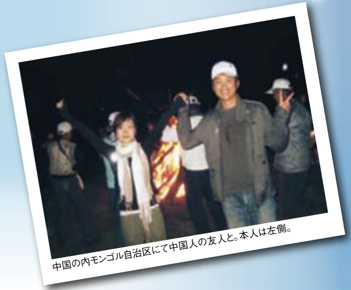
中国の内モンゴル自治区にて中国人の友人と。本人は左側。

自分の大学生生活を振り返ってみると、とにかく「経験」の多い4年間でした。オーケストラ部に入ってバイオリンを始めたり、週5日アルバイトをしたり、海外旅行や短期の語学研修に行ったり、就職活動で苦戦したり、教育実習に参加したり、さまざまなことに挑戦したと思います。実際に自分の身をもって体験したことは、楽しかったことも辛かったことも、必ずその後の自分の糧になると、卒業を目前にして実感しています。たくさんの気の合う友人や尊敬できる先生方に出会うことができ、とても恵まれていました。また、最近卒業論文の作成を終えました。提出日前日には徹夜もしましたが、仲間とともに勉強に励んだ時間はとても楽しい思い出です。今年、社会人になりますが、これまで学んだことを総動員して頑張っていきたいと思います。