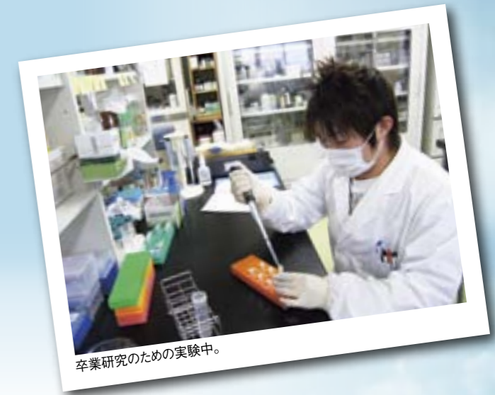
卒業研究のための実験中。

私はこの春から、新潟大学大学院へと進学する。しかし、3月でひとまず節目を迎える。4年生として、学部生最後の年次として、この4年間で培った力のすべてを卒業論文へと注ぎたいと思う。そして、次へのステップへとつなげていきたいと思う。