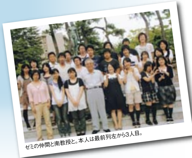
ゼミの仲間と南教授と。本人は最前列左から3人目。

振り返ってみればあっという間の4年間でしたが、多くのことを学び、充実した日々を過ごすことができました。これからは大学生活で得た知識や経験を生かし、社会人として力を発揮していきたいです。