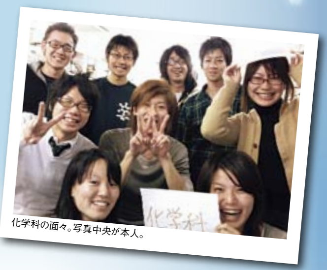
化学科の面々。写真中央が本人。