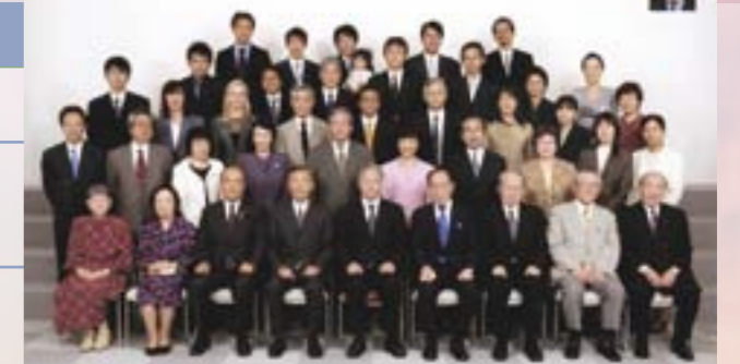
医学部公衆衛生学教室開講六十年記念祝賀会。

大学に赴任後も、国際保健としての仕事をアフリカで10年以上行ってきた。今度はWHOに対抗し、プライマリ・ヘルス・ケアの