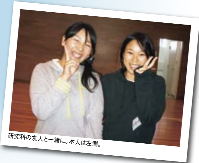
研究科の友人と一緒に。本人は左側。

大学院進学を目指し始めた時から、教師になることは、私にとって大きな目標でした。しかし、今後はそれを出発点とし、大学院で得た知識と経験を糧に、これから出会う生徒たちと共に一歩一歩前へ進んでいきたいと思っています。