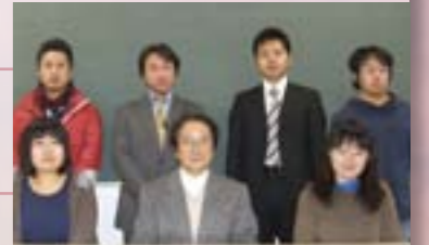
夜間主ゼミのみなさん。

ら経済学部の仕事となります。夜間教育の流れは4年制の夜間主コースへと引き継がれました。今、思い返して、その伝統に何を付け加えたのでしょうか。先輩諸先生の熱意や事務の方々の助け、そして、熱心に勉強に励む学生のそのキラキラ輝く目をバネにやってきたと思います。