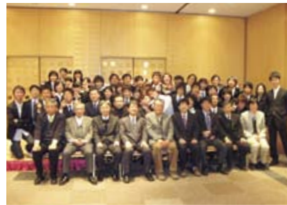
卒業研究発表打ち上げ会場にて。本人は右端。

4年間は瞬く間に終わってしまう。その時間の中で目標を抱き達成出来れば、充実した大学生活であったと胸を張ることが出来るであろう。目標は何でも良い。TOEICの点数を伸ばすことでも、サークル活動を頑張ることでも、資格試験に挑戦することでも何でも良い。私は大学院に進学してからも努力するつもりである。後輩の皆さんにおいても、充実した大学生活を過ごされることを期待します。