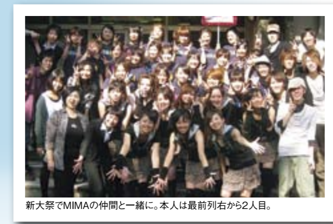
新大祭でMIMAの仲間と一緒に。本人は最前列右から2人目。

私の大学生活は、周りの人に恵まれていて、本当に充実した4年間でした。この場を借りて、私を支えてくれたすべての人に感謝したいと思います。