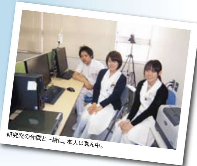
研究室の仲間と一緒に。本人は真ん中。

大好きな新潟大学を去るのはとても寂しいですが、学んできたことや感じたことを多くの人に伝えられるように頑張りたいと思います。