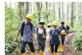
熱帯林での演習(農学部・インドネシア)