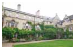
オックスフォード大学ハートフォードカレッジ

読解、作文、リスニング、発話の技能をバランスよく伸ばす授業により、英語によるコミュニケーション能力を総合的に高めることを目指します。各国の文化を学んだり、学生寮での生活やホームステイを経験します。オックスフォード大学ハートフォードカレッジ(イギリス)、アルバータ大学(カナダ)、クイーンズランド工科大学(オーストラリア)の経験豊富な講師陣による指導は、日本での授業とは異なる点も多くあり新鮮で、学習意欲も高まることでしょう。例年50名程度の学生が参加しており、参加学生の多くが帰国後に長期留学を目指しています。