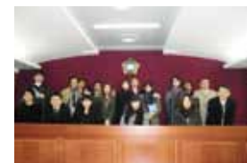
裁判所での研修(法学部・韓国)

各学部で用意している、それぞれの。たとえば、海外の裁判所で研修したり、各専攻に合わせたプログラムが組まれています。