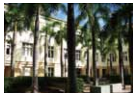
オーストラリア多文化共生社会体験(クイーンズランド工科大学)