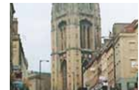
プリストル大学(イギリス)