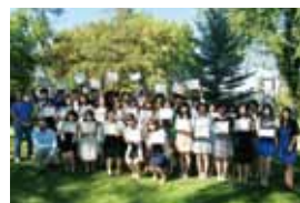
カナダ・サマーセミナー(アルバータ大学)

語学研修・異文化体験などを目的とした、全学部の学生を対象としたプログラムです。海外の大学の学生寮に住んだり、ホームステイをして現地のファミリーと交流したり、海外の生活、異文化に触れることができます。