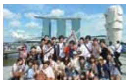
シンガポール・スプリングセミナー

世界を結ぶハブ都市として金融や物流の中心にあるシンガポールで、午前は英語研修を受講し、午後は日系企業などを訪問します。国際舞台の第一線で活躍する方々から、国際的な環境で働くことの面白さや難しさなどを聞き、意見交換をします。英語研修先は、東南アジア教育大臣機構(SEAMEO)とシンガポール政府が合同で設立している地域言語教育センター(RELCC)です。丁寧な発音指導と、日本人が不得意とするオーラルコミュニケーションに力を入れたプログラムで、シンガポールの歴史や文化についても学びます。