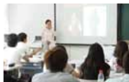
北京サマーセミナー(清華大学)

北京大学と双璧をなす清華大学は中国の最重要大学であり、中国では最も古い歴史を持つ大学のひとつです。清華大学で行われる「北京サマーセミナー」は、中国語の大幅な学力アップが最大のポイントですが、更に文化、社会、経済面での多角的なプログラムが組まれ、相乗的にコミュニケーション能力の向上が図れるよう構成されています。20年の実績があり、これまで359名が参加し、参加者のうち100名以上が清華大学や北京大学への長期留学を実現しています。