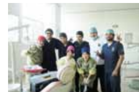
大学での歯科実習(歯学部・メキシコ)

専門分野を学ぶためのプログラムをしたり、医療現場で臨床研修を経験が組まれています。