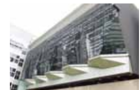
シドニー工科大学(オーストラリア)