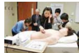
看護実習室での体験学習(医学部保健学科・カナダ)