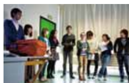
フランスナント大学での研修

新潟大学には、フランス語、ドイツ語、ロシア語、中国語、韓国語など、英語以外の言語の学習機会も豊富にあり、交換留学ができる協定校も各国にあります。フランス語や韓国語については、協定校等の協力を得て、夏休みや春休みに語学学習を中心としたショートプログラムを毎年のように実施しています。