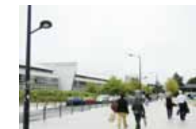
ナント大学(フランス)

世界中の大学との間で結ばれた交流協定に基づき、一定期間、学生を海外の協定校へ派遣する制度です。派遣先では外国語や専門科目などを現地の学生や世界からの留学生と共に学ぶことができます。