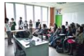
仏語・仏文化研修(人文学部・フランス)

専門分野を学ぶためのプログラムをしたり、医療現場で臨床研修を経験が組まれています。