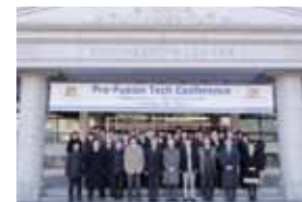
海外での学会参加(工学部・韓国)