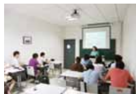
北京サマーセミナー(清華大学)