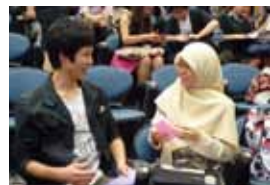
シンガポール・スプリングセミナー(シンガポール国立大学)