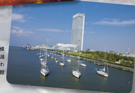
信濃川河口にある船の姿を模した朱鷺メッセ。ここで新潟大学の入学式や卒業式が行われ、周辺にはホテルや美術館があります。