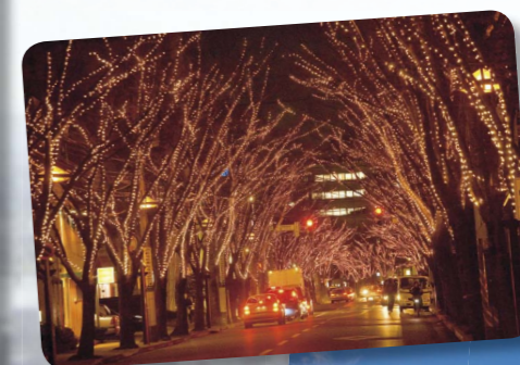
毎冬、新潟駅南口では木々が光で飾られた光のページェントが行われています。