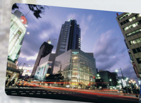
新潟のメインストリートの一つ、古町の一角。大型ショッピングビルが並びます。