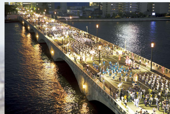
信濃川をまたぎ、新潟駅・万代と古町をつなぐ萬代橋。夏には新潟まつりの民謡流しやパレードが行われます。

さらに、毎年夏には、14,000人以上と日本一の踊り手が参加する大民謡流しと夜空を彩る12,000発もの打上花火が目玉となっている新潟まつりが盛大に行われるなど、魅力あふれるイベントが年間を通して行われています。