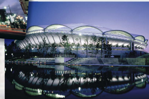
アルビレックス新潟の試合やコンサートが行われるビッグスワン。周辺には公園等が整備され、2009年にはHARD OFF ECOスタジアムが完成しました。