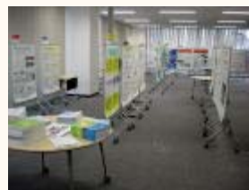
<ポスター展示風景>