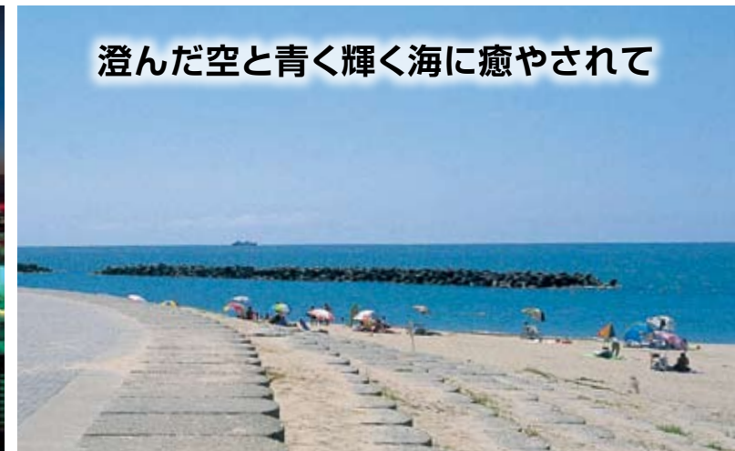
↑人口80万を擁する政令指定都市・新潟。日本海最大の都市は自然とともに調和、共存する。