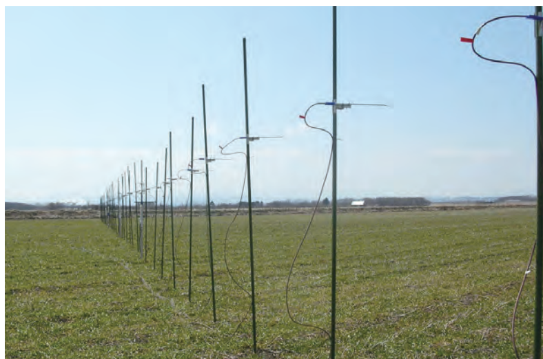
地表付近の風の空間構造を捉える観測の様子