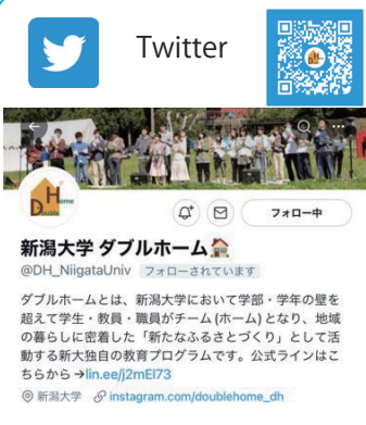
質問・ホーム紹介