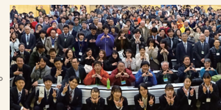
ダブルホームシンポジウム