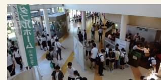
ダブルホーム情報館