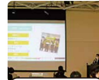
学生の成果報告の様子

2022年の報告会は、新型コロナウイルス感染症拡大防止の観点により、対面とオンラインを併用したハイブリッド形式にて開催しました。会員、学生(留学生を含む)、大学教職員の計114名の参加があり多くの方々から「有意義な会であった」等の感想が寄せられました。