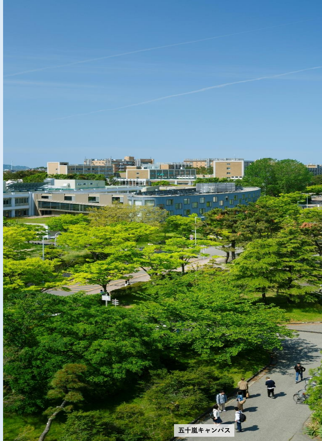
五十嵐キャンパス