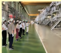
※インターンシップの様子

新潟県は創業100年を超える企業数が全国でも上位にあり、伝統の継承と時代に合わせた革新を繰り返しながら国内外で高い評価を得ている企業が多くあります。本科目は、新潟地域連携コミュニティ主催のインターンシップ体験事業 ※ を活用し、夏と春の長期休業期間に約1週間にわたり県内複数企業への訪問や社員取材を交えて実施します。新潟県内企業の魅力・強みと、それを生み出す背景や風土を深く理解するとともに、自身のキャリア観について新たな気づきを得ることもねらいとしています。