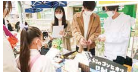
大学生による地域活動の様子