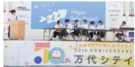
県内大学生が企画した「鮭プロフェス」。 新潟市の万代シティパークで開かれた