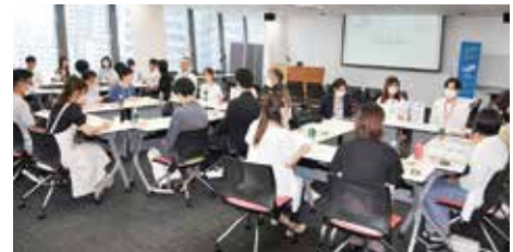
新潟市のメディアシップで開かれた「鮭プロにいがたカフェ」。 大学生と県内企業若手社員が交流した