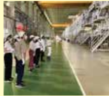
*インターンシップの様子

新潟県は創業100年を超える企業数が全国でも上位にあり、伝統の継承と時代に合わせた革新を繰り返しながら国内外で高い評価を得ている企業が多くあります。本科目は、新潟地域連携コミュニティ主催のインターンシップ体験事業*を活用し、夏と春の長期休業期間に約1週間にわたり県内複数企業への訪問や社員取材を交えて実施します。新潟県内企業の魅力・強みと、それを生み出す背景や風土を深く理解するとともに、自分自身のキャリア観について新たな気づきを得ることもねらいとしています。