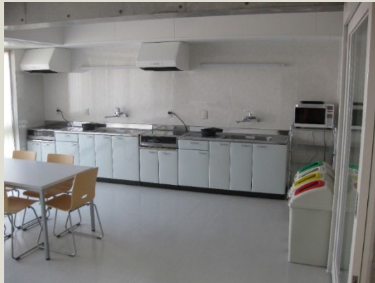
ダイニングキッチン